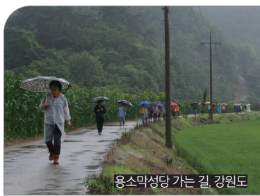
용소막성당 가는 길 강원도

“믿음은 우리가 바라는 것들의 보증이며 보이지 않는 실체들의 확증”(히브 11,1)이기 때문입니다.