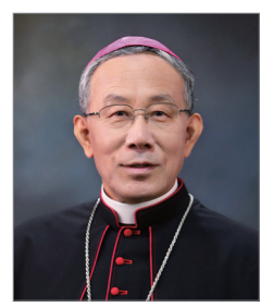
구요비 읍 주교 | 서울대교구 보좌주교